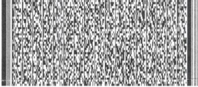
Timbre Electrónico SII

Res.99 de 2014 Verifique documento: www.sii.cl